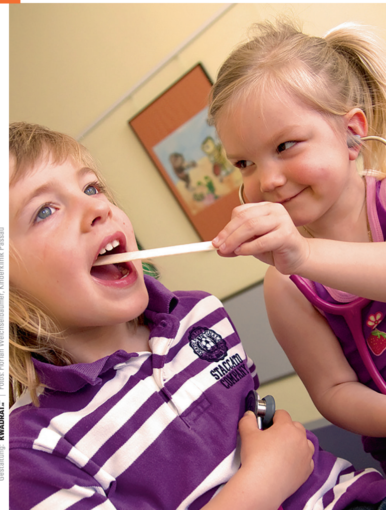
Gestaltung: KWADRAT

an der Kinderklinik Dritter Orden Passau, Zentrum für Kinder- und Jugendgesundheit Ostbayern