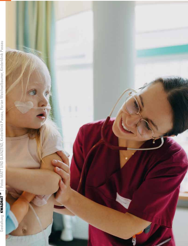
Gestaltung: KWADRAT

an der Kinderklinik Dritter Orden Passau, Zentrum für Kinder- und Jugendgesundheit Ostbayern