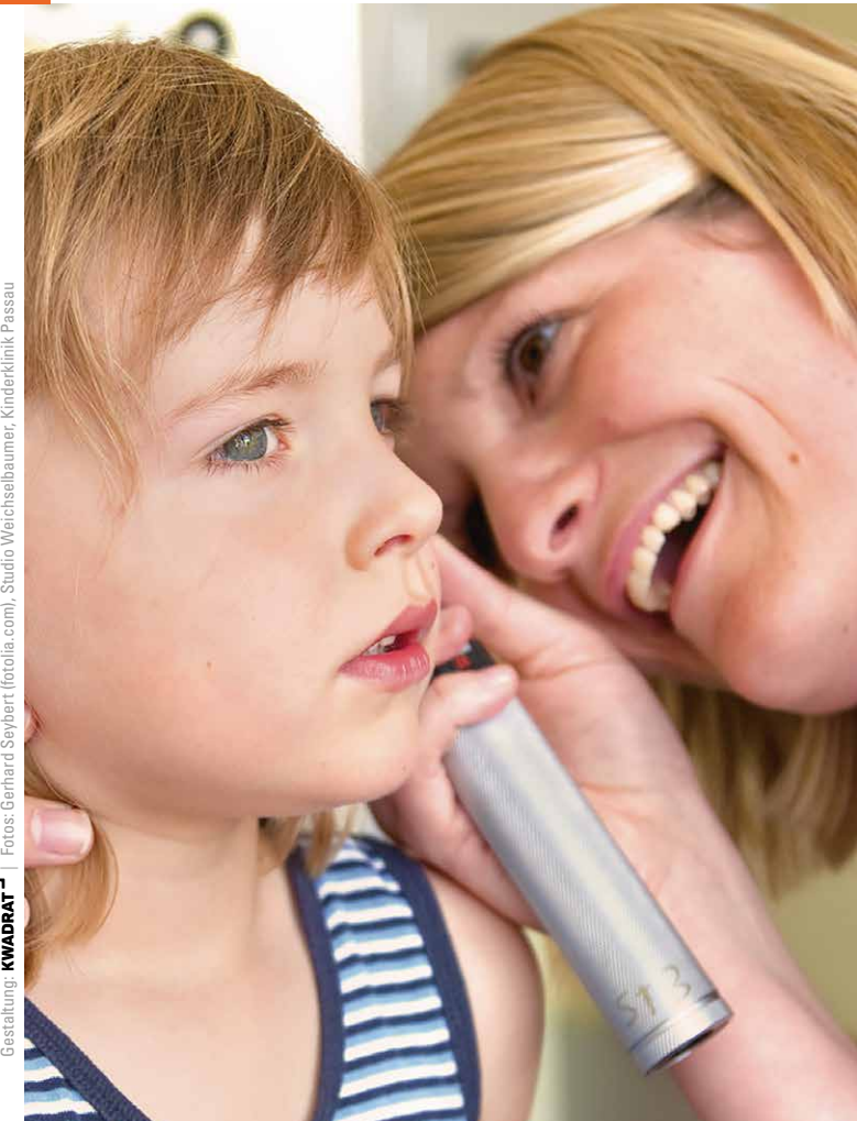
Gestaltung: KWADRAT | Fotos: Gerhard Seybert (fotolia.com), Studio Weichsbaumer, Kinderklinik Passau

Förderprogramm mit freundlicher Unterstützung durch die Stiftung Kinderlächeln